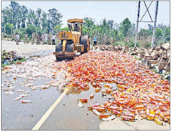
बराड़ा। शराब को रोलर की मदद से नष्ट करते हुए।