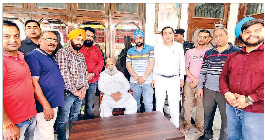
अंबाला। मंत्री अनिल विज से मुलाकात करते दुकानदार।

दुकानदारों ने कहा वह दशकों से पुरानी दुकानों में ही अपना कारोबार चला रहे थे और अब मंत्री अनिल विज की वजह से वह दुकानों को नए सिरे से बना सकेंगे साथ ही वह दुकानों के मालिक बन सके हैं।