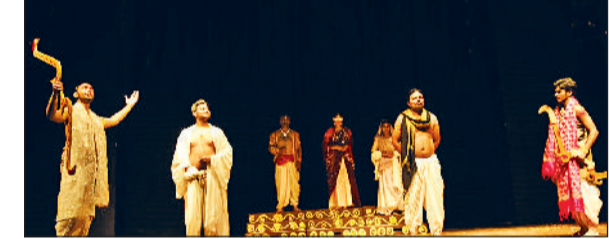
कुरुक्षेत्र। रंगमंच पर प्रस्तुति देते विद्यार्थी।